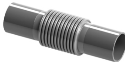
Megjegyzés| HWA típus - axiális kompenzátor | 3D nézet