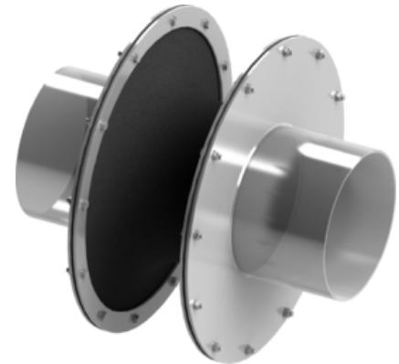
Anmerkung | Typ 43 - Weichstoff-Kompensator | 3D Ansicht